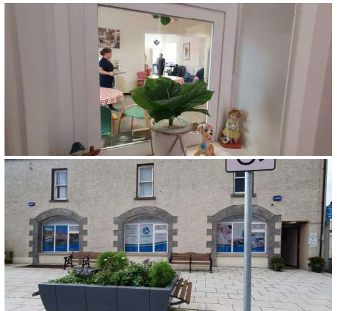
(데이케어센터 운영장면)