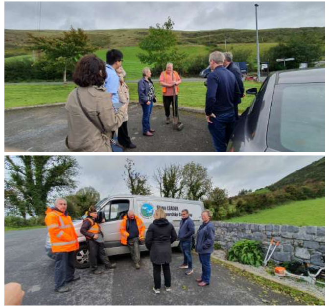
출처: 명형남.강마야 직접 촬영(경관을 위한 개보수작업)