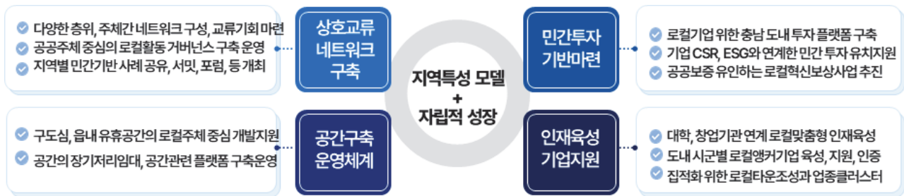
〈충남 로컬창조활동 생태계 형성의 정책추진과제〉