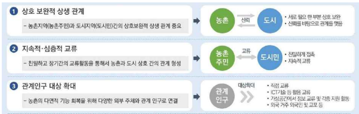
| 관계인구 창출 기본 방향 |