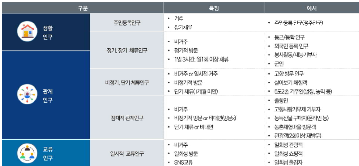
| 유형별 관계인구 형태 |